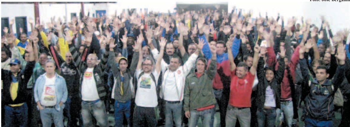
Assembleia do dia 29 de abril

para 2013, e há ainda aspectos inaceitáveis nos critérios, como o escalonamento em 5 valores.