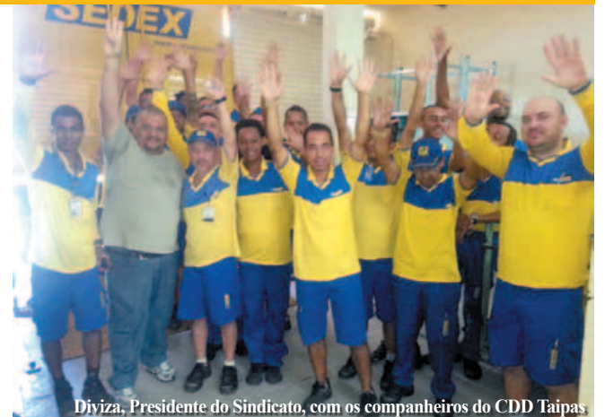
Diviza, Presidente do Sindicato, com os companheiros do CDD Taipas