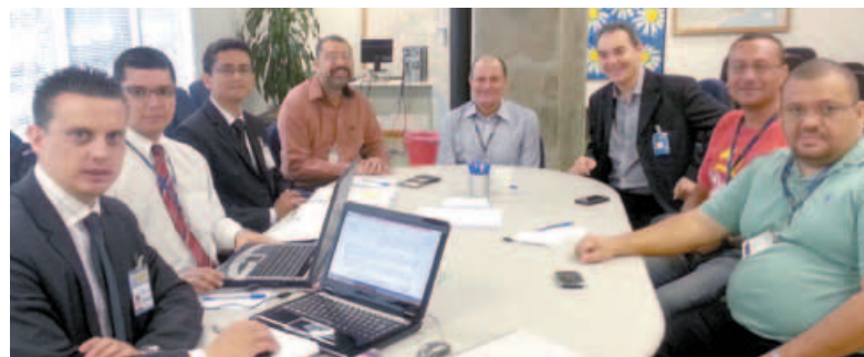
Sindicato reunido com a empresa na Mesa Regional de Negociação Permanente

Concurso Público: O Sindicato solicitou a realiza-