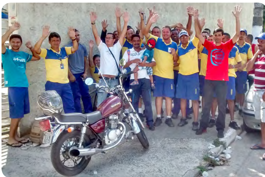
Trabalhadores do CDD aprovam a paralisação em assembleia com o Sindicato

Também devido a esse problema apareceram muitas ba-