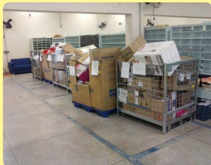
Encomendas espalhadas pelo setor devido à falta de funcionários para entregá-las