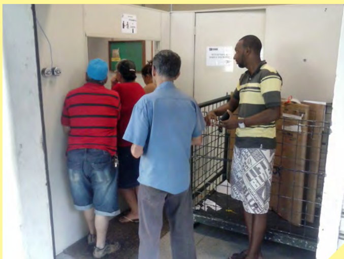
População faz fila e espera muito para retirar encomendas não entregues