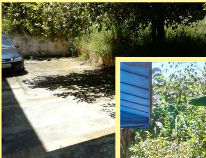
O matagal é criadouro de insetos como mosquitos e baratas e animais como lagartos e cobras