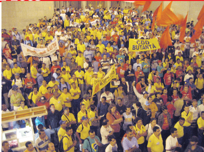
A praça estava lotada no dia 01/09 - No dia 13 vai estar muito mais!